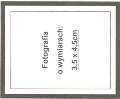
(nie wykraczać poza ramkę wewnętrzną)