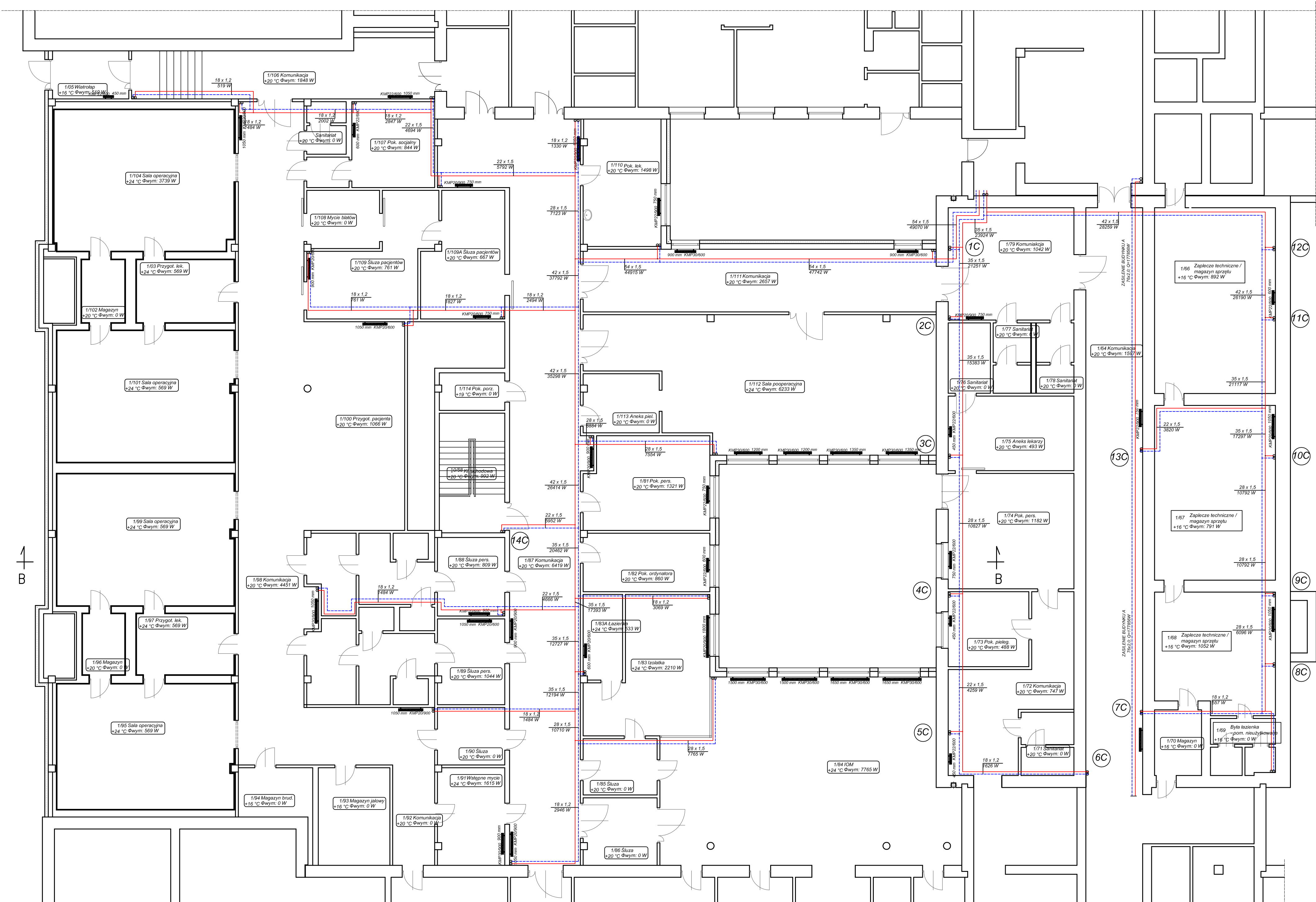
RZUT NISKIEGO PARTERU - SEGMENT B' i E skala 1:100