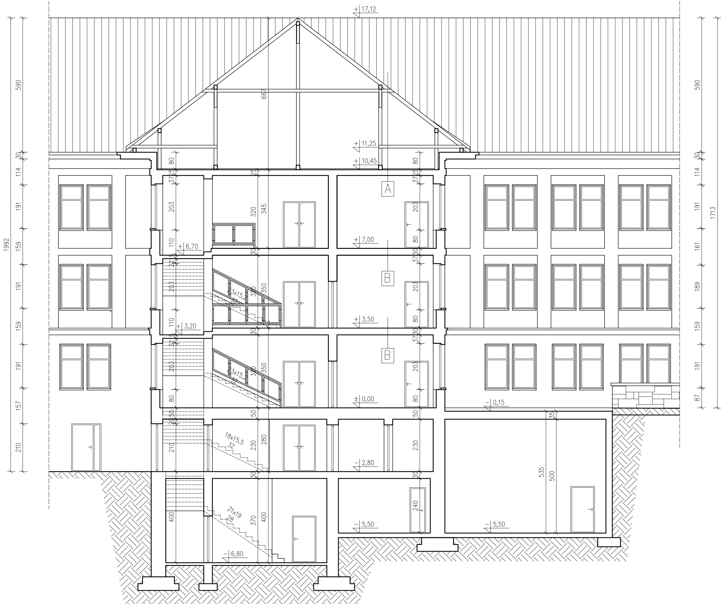
PRZEKRÓJ A-A skala 1:100